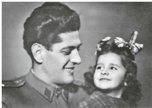
Mio padre e io nel 1950.

che io portavo a casa tutta felice dicendo: “Hai visto che cosa mi ha comprato la bella signora bionda?” Mia madre li gettava subito dalla finestra.