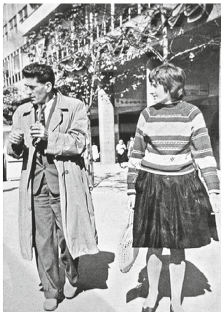
1962: con mio padre e la mia gonna multistrato.

Mi sentivano ovunque con quelle scarpe. Avevo paura anche solo a camminare per strada. Se c'era qualcuno alle mie spalle mi fermavo in un androne per farlo passare, tanto mi vergognavo. Ricordo in particolare una parata del 1° maggio in cui la nostra scuola aveva il grande onore di sfilare davanti a Tito in persona. La nostra formazione di marcia doveva essere perfetta e per questo avevamo fatto un mese di prove nel cortile della scuola. La mattina del 1° maggio ci trovammo per partecipare alla parata ma, poco dopo avere cominciato a marciare, una delle mie soles di metallo si staccò, impedendomi di procedere a tempo. Mi allontanarono immediatamente. E mi misi a piangere dalla vergogna e dalla rabbia.