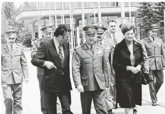
Belgrado, 1966: mia madre durante la visita della delegazione bulgara.

Ho saputo inoltre che era stato mio padre a scegliere il mio nome, in omaggio a una soldatessa russa di cui si era innamorato durante la guerra; una granata l'aveva fatta in mille pezzi davanti ai suoi occhi. Mia madre mal sopportava quella forma di nostalgia – e, per un'applicazione della proprietà transitiva, penso che mal sopportasse anche me.