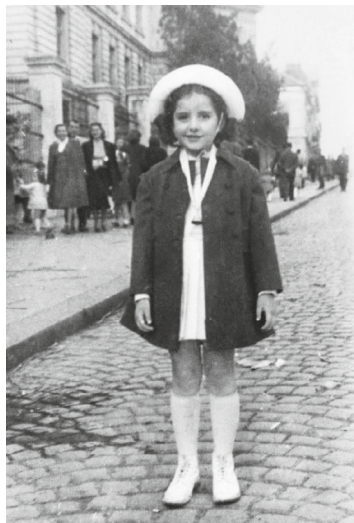
Io a Belgrado, 1951.

di seconda mano. Come se i capi avessero sbirciato il comunismo di qualcun altro per poi costruire qualcosa di peggiore, di meno funzionale e di più pasticciato.