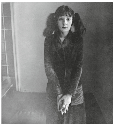
Io con il vestito che ricavai dalle tende, 1960.

Fin da quando avevo sei o sette anni sapevo di voler diventare un'artista. Mia madre mi puniva per tante cose, ma mi incoraggiò in quell'unica direzione. Perché l'arte per lei era sacra. Così nel nostro grande appartamento non solo avevo una camera da letto tutta per me, ma anche uno studio dove dipingere. E mentre il resto della casa era zeppo di roba, quadri, libri e mobili, fin da piccola tenevo entrambe le mie stanze in un ordine spartano. Il più vuote possibile. In camera mia c'erano solo il letto, una sedia e un tavolo. Nello studio, solo il cavalletto e i miei quadri.