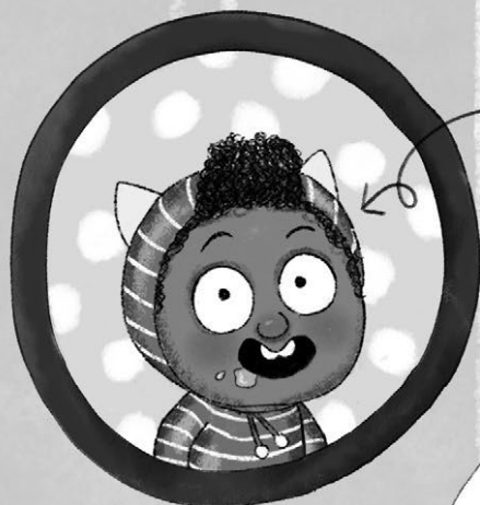
ALFIE Puzza e rompe le scatole.