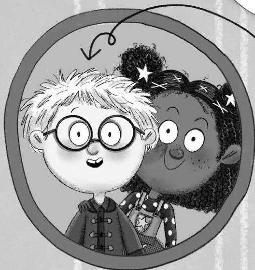
ARTHUR Il mio miglior amico (umano).