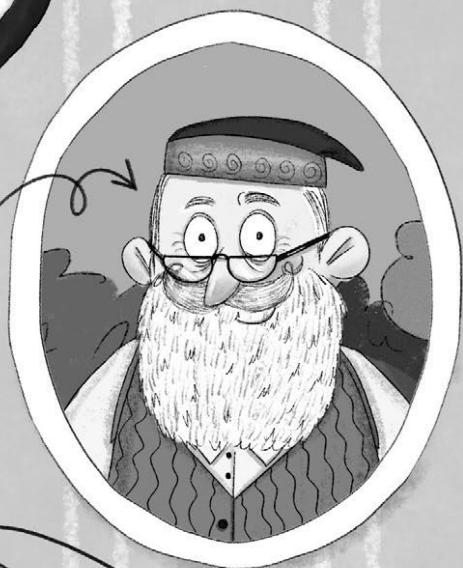
NONNO Il mio mago preferito!